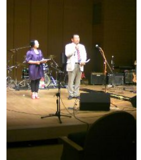
7月23日 「バンドフェスタOkazaki2011」で 会長挨拶