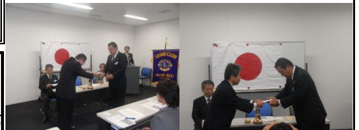
11月第1例会、岡崎市青少年少女発明クラブと愛知県知的障害者養護学校体育連盟の2団体に助成金の贈呈

ライオンズの誓い われわれは知性を高め、 友愛と相互理解の精神を養い、 平和と自由を守り、