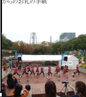
11月6日、東日本復興支援コンサート「パワー・オブ・ミュージック」の様子