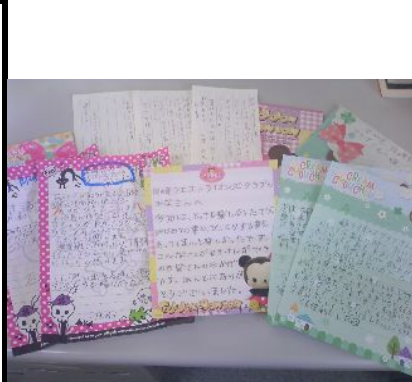
8月の小学生交流事業、八重山の子供たちからのお礼の手紙