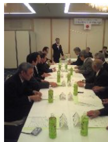
4R委員長会議 GMT・GLT委員会